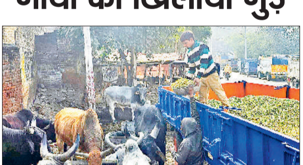
गोहाना। ट्राली से गायों के लिए हरा चारा डालते हुए संस्थान के सदस्य।