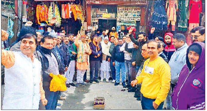
गन्नौर। मुख्य बाजार में आतिशबाजी करते गन्नौर व्यापार मंडल के पदाधिकारी व सदस्य।

राम की प्राण प्रतिष्ठा को लेकर जगह-जगह चौराहा पर लोगों पटाखे छोड़े और आतिशबाजी की