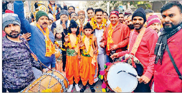
गन्नौर। नामकरण के बाद डोल नगाड़ों की थाप पर थिरकते श्रीराम मार्केट के दुकानदार।