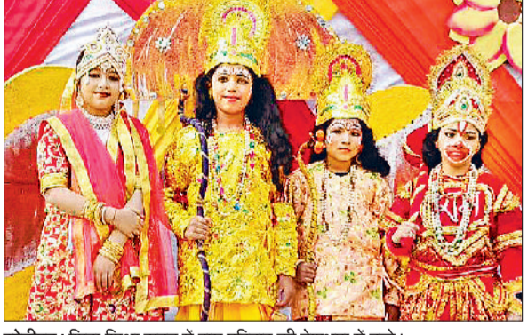
सोनीपत। शिवा शिक्षा सदन में राम परिवार की वेशभूषा में बच्चे।