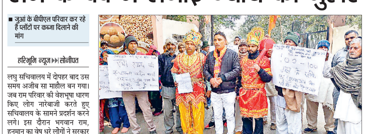
सोनीपत। सचिवालय के बाहर राम परिवार की वेशभूषा में ग्रामीण विरोध प्रदर्शन करते हुए।