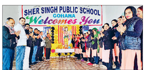
गोहाना। भगवान श्रीराम के चित्र पर पुष्प अर्पित कर नमन करते हुए गुरुजन।